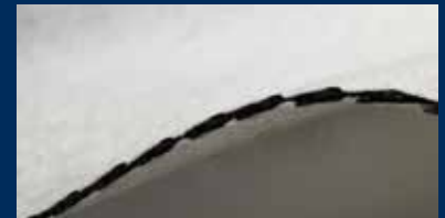
TenCate Polyfelt® DC

TenCate Polyfelt® DC-Dränmatten sind Geoverbundstoffe aus einem Geonetz mit ein- oder beidseitig aufkaschiertem Filtervliesstoff. Das Geonetz besteht aus Polyethylen hoher Dichte (PE-HD), das Filtervlies aus Polypropylen (PP). DC-Dränmatten zeichnen sich durch geringe Zusammendrückbarkeit aus und werden überall dort eingesetzt, wo eine Flächendränage erforderlich ist.